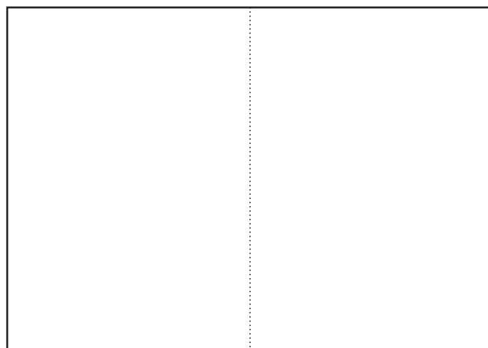
P3 (中央見開き) P2